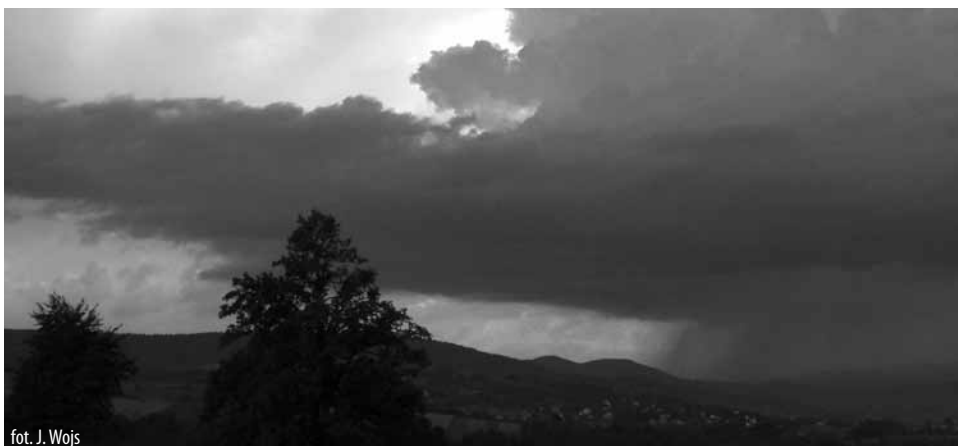
fol. J. Wojs