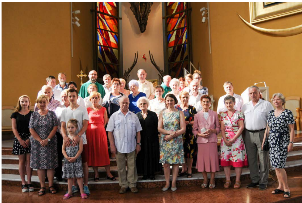
fot. pijarzy.pl / 20-lecie Akcji Katolickiej

Rozpiętość wiekowa w naszym Oddziale Akcji Katolickiej jest znaczna. Od czterdziestu „plus” do osiemdziesięciu „plus”. Mamy wśród nas trzy małżeństwa, ale też są osoby samotne.